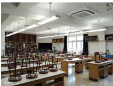
施工前 (本館化学教室)

(工期・工事金額及び請負工事業者) 2025.7～2025.8 40,150 千円 朝陽電気 (株)