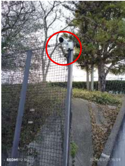
駐車場監視カメラ 1 台設置