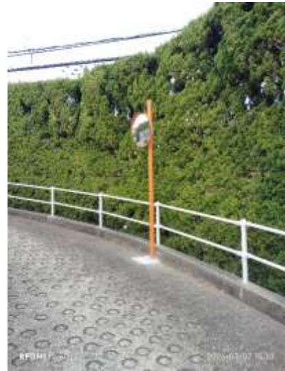
駐車場入口にカーブミラー設置