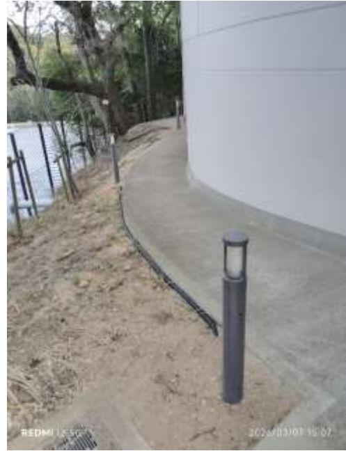
駐車場通路側照明設備計 3 か所設置