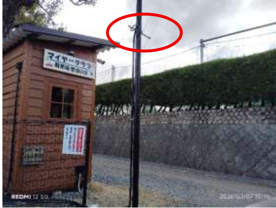
駐車場入口付近に登下校通報システム用アンテナ設置