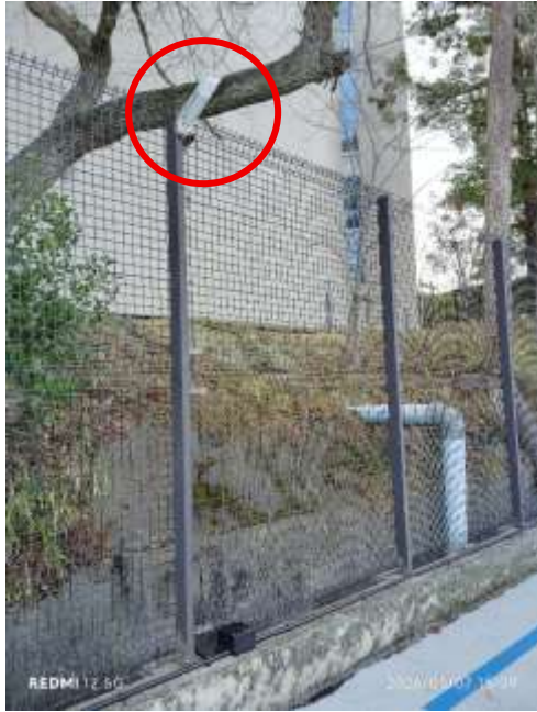
駐車場内照明設備計 8 か所