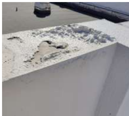
内部に水が浸潤している