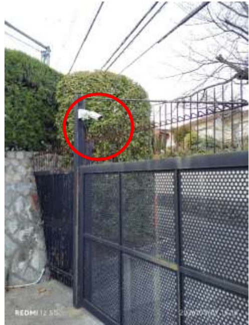
駐車場北門監視カメラ 1 台設置